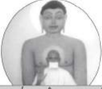
પૂ. આચાર્ય સમ્રાટ શ્રી અજરામરજી સ્વામી અજરામર તીર્થધામ

|| જય અજરામર || || તસ્મે શ્રી ગુરવે નમઃ || || જય મહાવીર ||