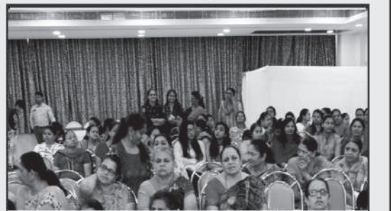
શિબીરમાં ધ્યાનમગ્ન બહેનો