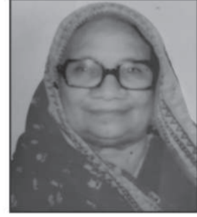
દાદી ભચીબેન પાલણ ગાલા

ઓ મા વિશલ આવ્યો દોડી પહેડી તારી કરવાને રંક રાય તને શીશ મુકાવે આવે તને કરગરવા ને રે માડી આવે તને કરગરવા ને