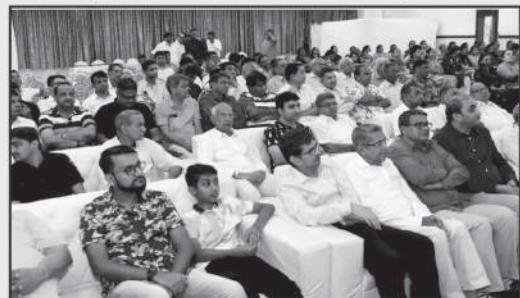
સ્વાસ્થ્ય સંબંધે સજાગ રહેવા બોધ ગ્રહણ કરતા ભાઈઓ