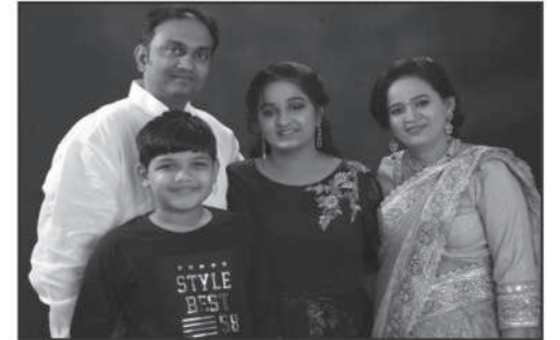
કીર્તીદા અમીત અમરશી ગાલા

શ્રી છસરા જમ્બદેવ તથા વિશલમાતાજીના સ્થાને નમતા ગાલા ભાવીકો તથા સહભાવીકોને સહર્ષ જણાવવાનું કે છસરા સ્થાનીકે ચૈત્ર સુદ પુનમ સંવત ૨૦૭૫ તા. 19.04.2019 ને શુક્રવાર સવારે 9.00 કલાકે મોટા યક્ષ મંદીરે પહેડી પ્રસાદ ચડાવવામાં આવશે. તે પછી સ્થાનીકે ધજાની બોલી પછી 11 વાગે પહેડી પ્રસાદ તથા આરતી કરવામાં આવશે. તા. 18.04.2019 ને ગુરુવારે સવારે 8.30 કલાકે હવન કરવામાં આવશે તો આ બંને પ્રસંગે સર્વે ભવીકો તથા સહભાવીકો તથા નિયાણી બહેનોને સહકુટુંબ પધારવા આમંત્રણ આપીએ છીએ.