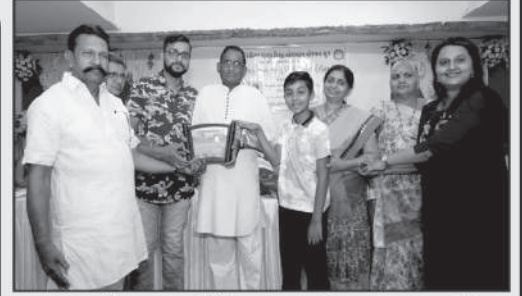
દાતા પરિવારના સભ્યોને સન્માનપત્રથી નવાજતા પ્રમુખશ્રી