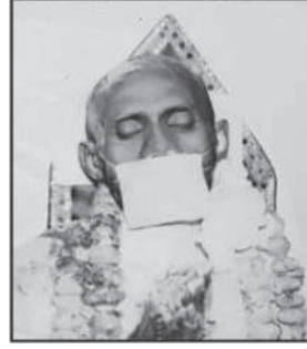
પિતાશ્રી અનશન પ્રતધારી શ્રી અમરશી પાલણ ગાલા