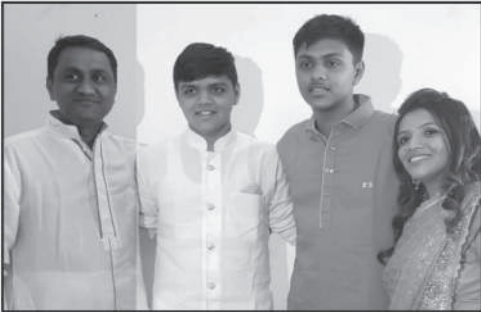
જુનલ વિશલ અમરશી ગાલા

ઓ મા વિશલ આવ્યો દોડી પહેડી તારી કરવાને રંક રાય તને શીશ મુકાવે આવે તને કરગરવા ને રે માડી આવે તને કરગરવા ને