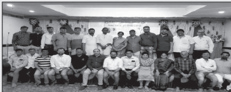
શિબીર સમાપ્તિબાદ સફળતાનો સમુહ સંતોષ