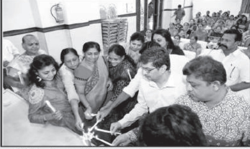
જયોતીસે જયોત જગાતે ચલો...મંગલદીપ પ્રાગટ્ય કરતા મહાનુભાવો