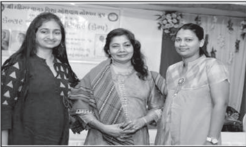
સુશીલ સન્નારી ફાલ્ગુનીબેન સત્રાનું સન્માન