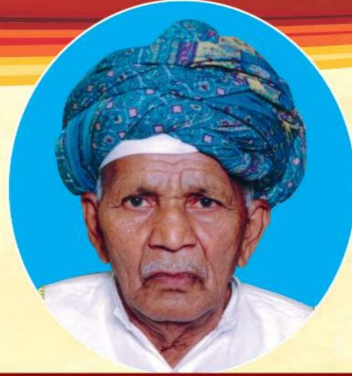
પિતાશ્રી ગોવર આંબા ગડા